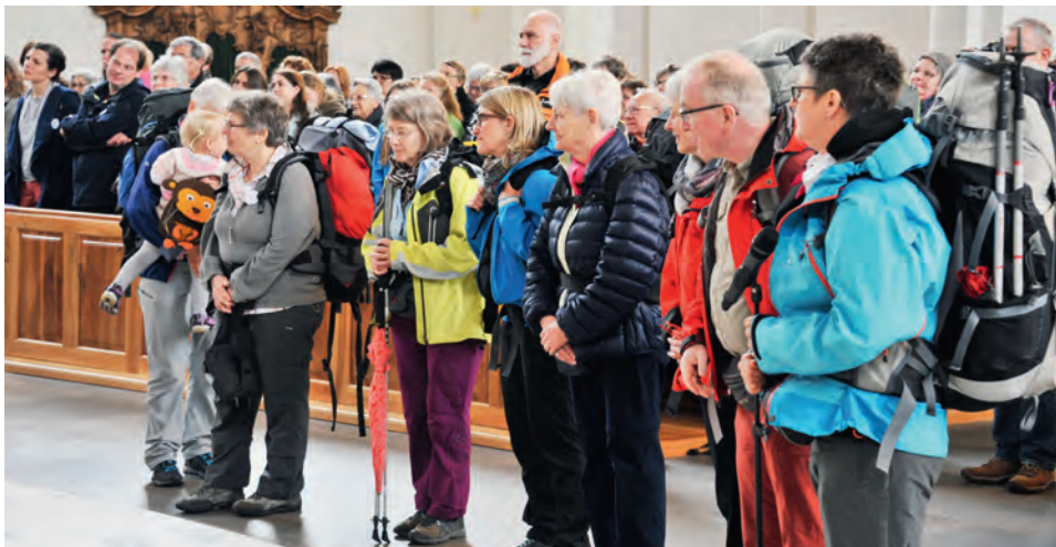
Die sieben Frauen und der eine Mann, welche die ganze Strecke nach Rom pilgern Segnungsgottesdienst in der Kathedrale St. Gallen.