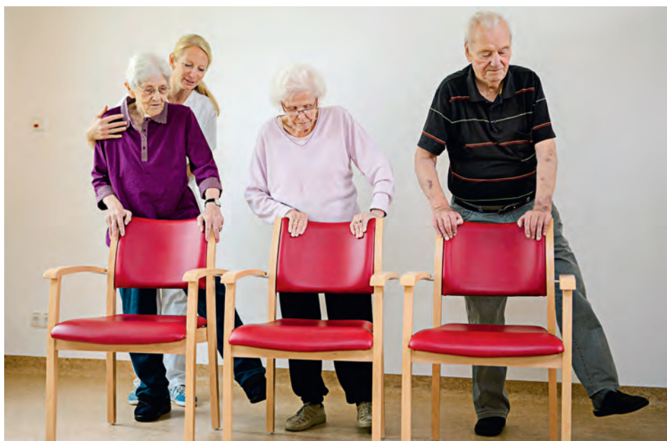
Senioren werden heute nicht nur älter, sie sind auch noch geistig und körperlich fit.

Leider hat Bischof Vitus seine Teilnahme an der Sitzung kurzfristig abgesagt, was der Rat sehr bedauerte. Es wäre interessant gewesen, eine Stellungnahme des Bischofs zu «Amoris laetitia» zu hören. Der RLD sprach sich für eine gemeinsame Sitzung mit dem Priesterrat im September aus, an der das päpstliche Schreiben beleuchtet werden soll. Dabei sollen die verschiedenen Lesarten des Dokuments berücksichtigt werden. Ebenso sollen die praktischen Konsequenzen beraten werden können.