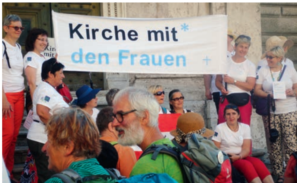
Die Pilger/-innen mit dem einen Anliegen in Rom.

An einem Pilgertag in Rom wurde die Ankunft der Pilgerinnen gefeiert, die «Für eine Kirche mit* den Frauen» von St. Gallen nach Rom gelaufen waren. Mehrere Hundert Unterstützer/-innen beteten, sangen und bestärkten einander mit ihrem Anliegen in der Ewigen Stadt.