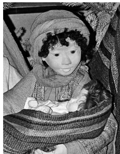
Unsere Krippendarstellungen vermitteln eher heile Welt.

für Nazareth als Geburtsort Jesu votiert hat. Gegenwärtig ist dieses Thema aber nicht mehr Gegenstand der Forschung, zumal es zu dieser Frage kaum neue Befunde gibt. Für die Frage, wer dieser Jesus von Nazareth gewesen ist, steht das Wissen um den historisch gesicherten Geburtsort ohnehin nicht im Vordergrund.