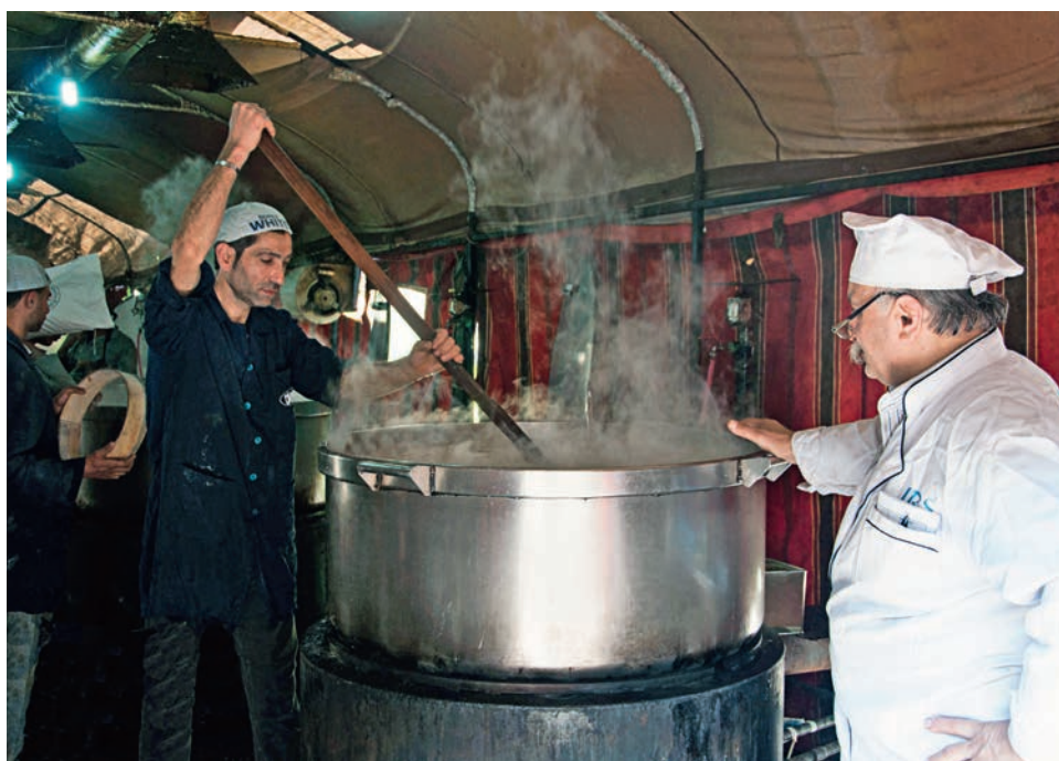
In Grossküchen werden in den Städten Syriens täglich Tausende von Mahlzeiten zubereitet.