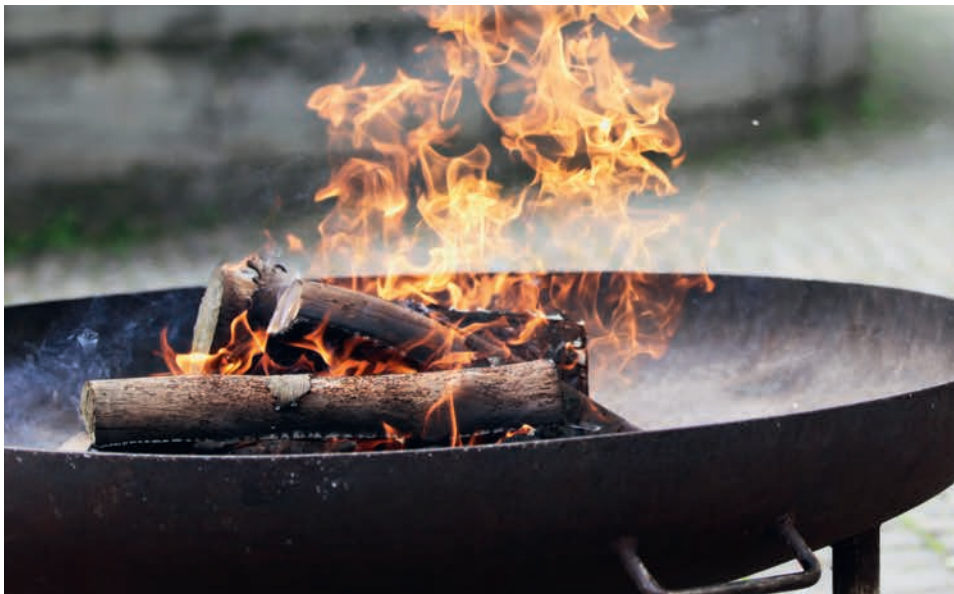
Am Ende der Fasnacht werden in Schwyz die Masken dem Feuer übergeben. Am Ende der Fastenzeit kommen die Palmzweige ins Osterfeuer, deren Asche wird für die Aschenausteilung am Aschermittwoch benutzt.