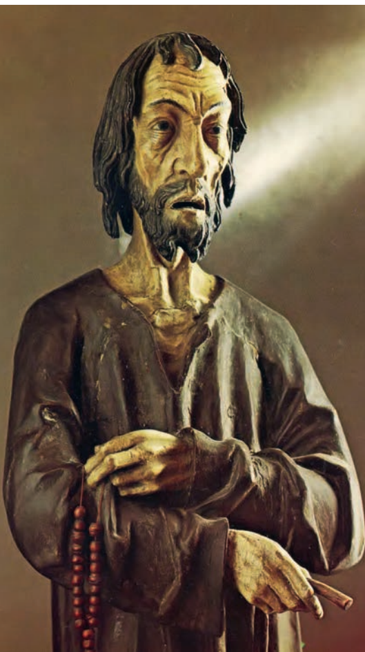
Statue des Bruder Klaus.

Die Liebesbriefe regen nicht nur dazu an, die eigenen Gewohnheiten im Alltag neu zu überdenken, sondern auch unsere Beziehungen. Seien es Liebesbeziehungen, Freundschaften oder die Beziehung zu Gott selbst.