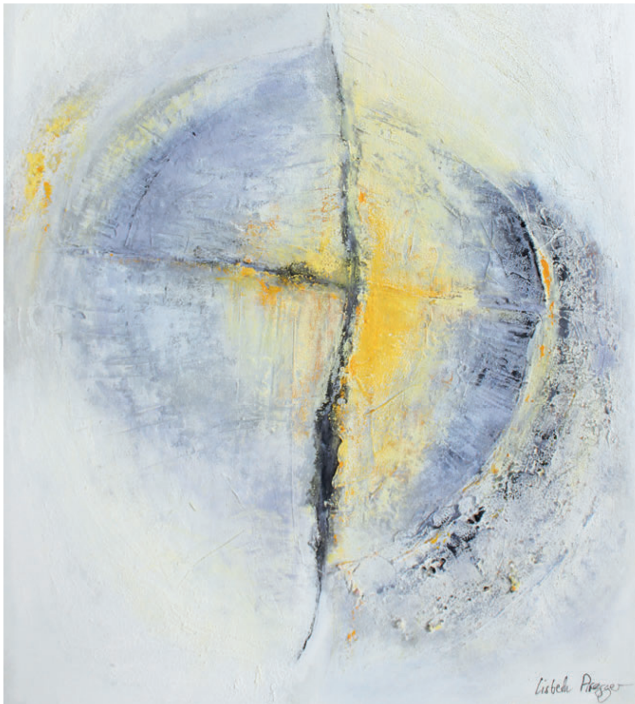
Lisbeth Aregger-Renggli, Malers: «Aufbruch» 2007 Acryl-Mischtechnik, 60 x 80 cm

Erstfeld Silenen Amsteg Bristen Seelsorgeraum Urner Oberland Gurtnellen Wiler/Dorf Wassen/Meien Göschenen/Göscheneralp