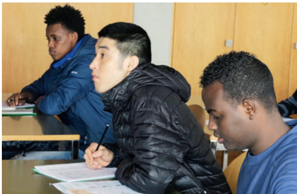
Asylbewerber lernen in Deutschkursen die Schweizer Sprache.

Stefan Frey verhehlt ein gewisses Befremden nicht: «Das Evangelium beschreibt mehrfach, dass man Fremden aufnehmen soll. Auch in der christlichen Tradition wurden Flüchtlinge bislang unabhängig von ihrer Herkunft aufgenommen.» Genau dies sagt auch Markus Büchel, Bischof von St. Gallen: «Meine christlichen Wurzeln, mein Christ-Sein bedeutet für mich, offen zu sein für alle Menschen in Not, egal welcher Staatsangehörigkeit oder Religion.»