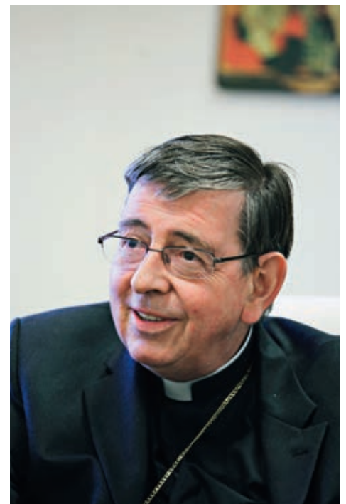
Kardinal Kurt Koch, ehemaliger Bischof von Basel und seit Ende 2013 Mitglied der Bischofskongregation.

Chur). Der Theologe macht darauf aufmerksam, dass der Schweizer Kardinal Kurt Koch Mitglied der Bischofskongregation ist. Franziskus hat den vatikanischen Ökumeneminister und früheren Bischof von Basel im Dezember 2013 zum Mitglied derselben ernannt.