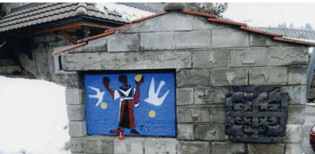
Das Bildstöckli «Bruder Immerfroh» (Relief mit Keramik) stammt von Christoph Zünd aus Guntershausen TG.