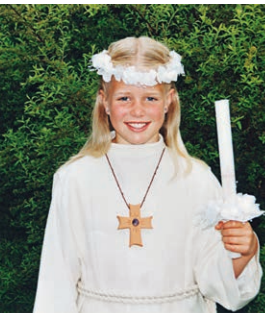
Die Erstkommunion im Kanton Uri soll auf die dritte Klasse verschoben werden.