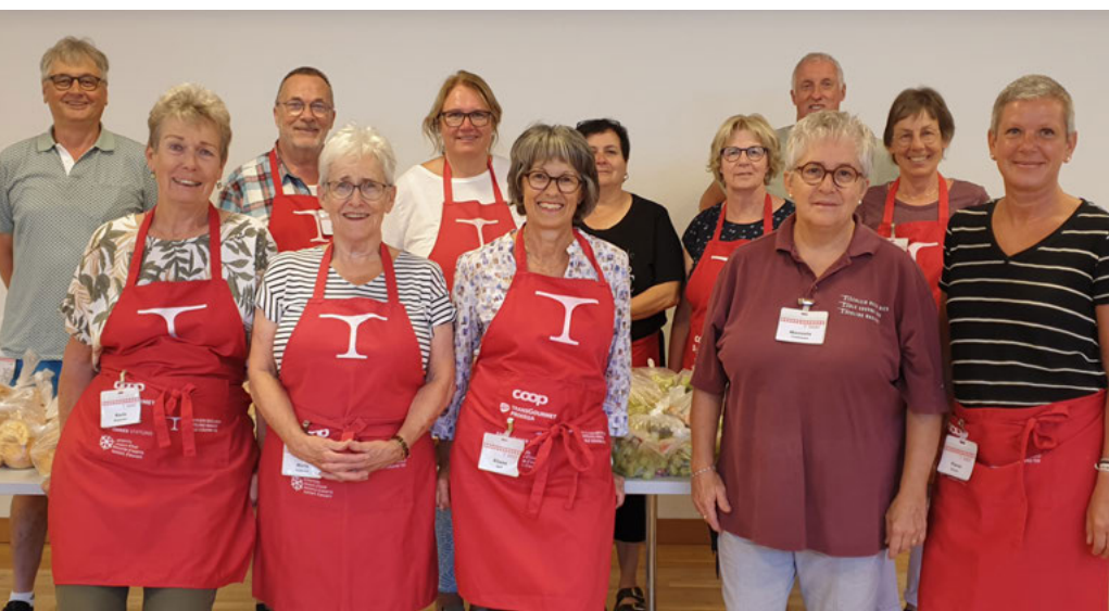
Sinnvolles Engagement – Die Ehrenamtlichen von «Tischlein deck dich» sorgen dafür, dass Lebensmittel gerettet und zahlreiche von Armut Betroffene unterstützt werden.