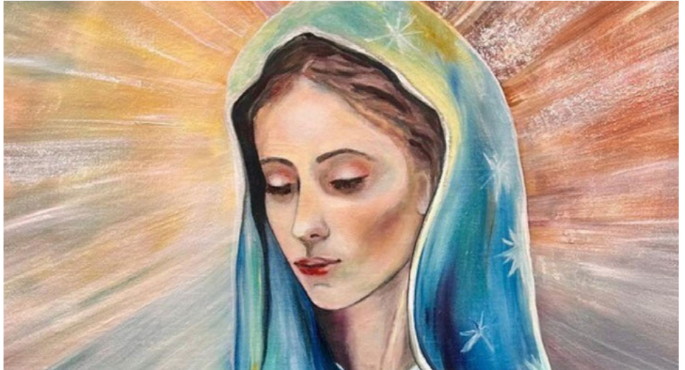
Eine schillernde Karriere: Maria, die junge Frau aus Nazareth, wurde zur Gottesmutter und Himmelskönigin, zeitweilig auch zu einer Art Kriegsgöttin. Unser Autor zeigt sie als Brückenbauerin.

Der Koran beharrt auch darauf, dass Jesus und Maria essen mussten wie wir alle und dass Maria etwa bei der Geburt Jesu ganz normale Wehen hatte und damit Schmerzen leiden musste wie wir alle. In der Spätantike lag darin ein Frontalangriff auf die imperiale Propaganda von Byzanz. Von daher spricht viel dafür, dass die Passagen des Korans, die