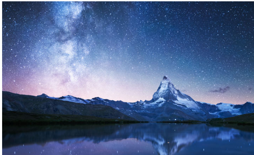
Der Nachthimmel erweckt Staunen. Frühere Zeiten sahen in den Planeten sogar Götter

Sie erhalten einen Dienst. Die Schöpfungsgeschichte ist keine Erklärung der Weltentstehung, sondern sie deutet die Urgeschichte theologisch. So heisst es in der Erzählung im