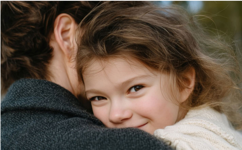
Die Kunst des Anfangens – Kindern fällt es oft leichter, unbefangen auf die Welt zuzugehen.