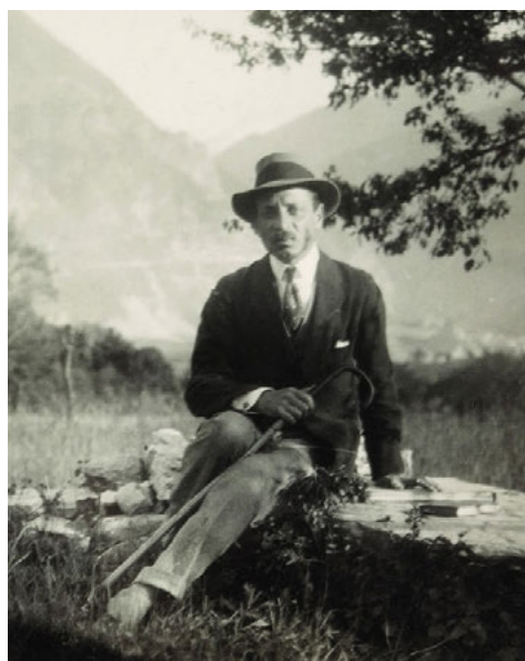
Rilke 1924 in Siders: Stets war er ein Reisender, erst im Wallis fand er eine Art Heimat.

Ein besonders zugängliches Gedicht ist «Herbst». Es beginnt: «Die Blätter fallen, fallen wie von weit ...» – ein sanftes Gedicht über das Loslassen und Gehaltensein.