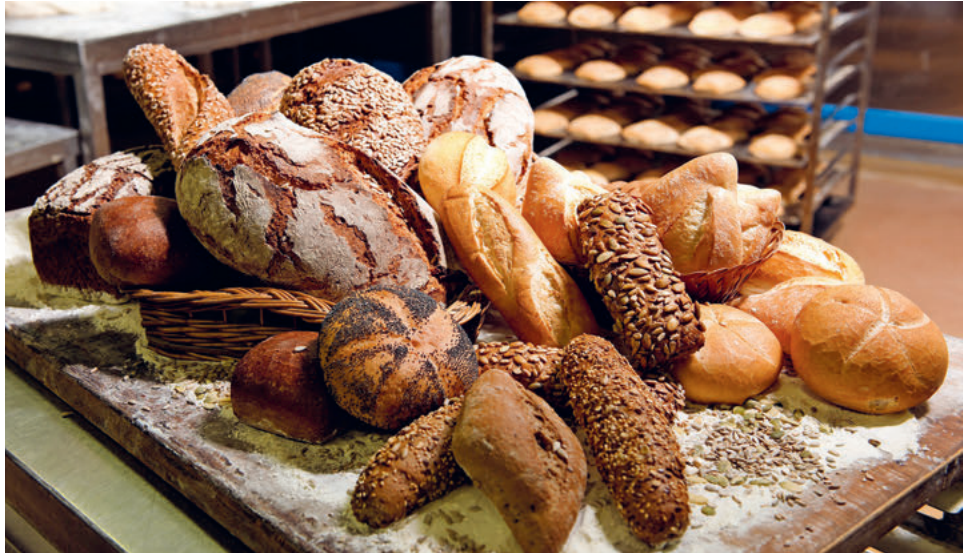
Schon beim Einkauf fällt die erste Entscheidung: Tagesgebäck oder haltbares Brot?

Kleinere Broteinheiten hingegen altern schneller. Auch Zopf und Gipfeli sind Tagesprodukte. Besonders kritisch sind jedoch industrielle Aufbackbrote. Diese wirken schon nach wenigen Stunden altbacken. Auch Brote aus Weissmehl trocknen schnell aus, ausser der Teig wurde lange geführt, nämlich 8-72 Stunden. Angeschmittenes Brot sollte man in einem Brotsack aus Baumwolle, Leinen oder aus Papier aufbewahren und auf der Schnittstelle aufstellen. Nicht geeignet sind hingegen der Kühlschrank und fest verschlossene Gefässe.