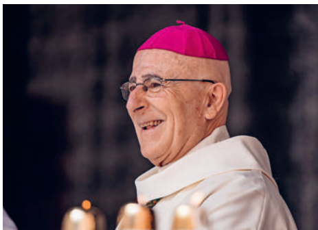
Bei so vielen Ausnahmen hat der Bischof gut lachen.

«Es waren fünf intensive Jahre», meinte der Bischof. Im Hinblick auf die grossen Spannungen im Bistum stellte er fest, dass die Polarisierung inzwischen abgenommen habe. Viel zusätzliche Arbeit beschert ihm auch das Ressort Missbrauchsbekämpfung und dessen Aufarbeitung, für das Bonne-