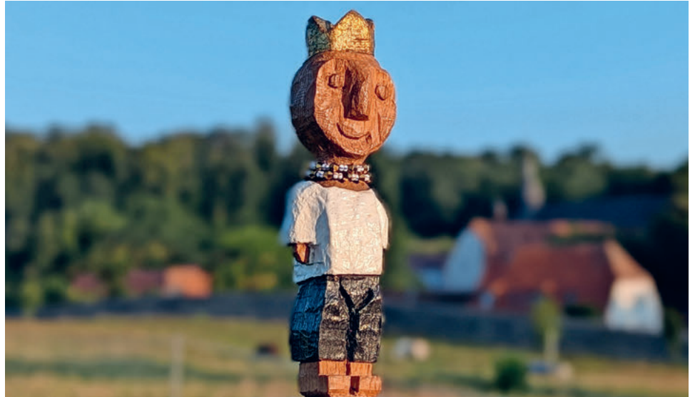
Der arme König – er hat keinen Namen. Manche nennen ihn «den Zufriedenen», weil er so fröhlich dreinschaut. «Ich habe das Gefühl, dass diese Figur Stress wegnimmt», sagt ein Passant. Bild: Ralf Knoblauch

Morgens zwischen fünf und sechs Uhr geht Ralf Knoblauch in seine Werkstatt und arbeitet an seinen Königen. Es ist ein medi-