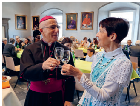
«Viva» – der Bischof fühlt sich unter den Leuten sichtlich wohl.

Noch in diesem Jahr soll Bischof Joseph einen Weihbischof zur Unterstützung erhalten – auch das eine Ausnahme, denn Bischöfe erhalten in diesem Alter normalerweise keine neuen Mitarbeiter mehr. Bonnemain fügt hinzu: «Allerdings ein Weihbischof ohne Nachfolgerecht, das habe ich dreimal unterstrichen.» Bei der Wahl seines Nachfolgers darf dann das Churer Domkapitel wieder mitreden.