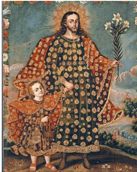
Es gibt ganz verschiedene Vorbilder, Männerbilder und Mannsbilder.