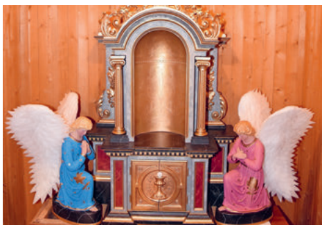
Nun stehen die Engel wieder dort, wo sie hingehören – am Tabernakel.

Ich suche weiter und finde noch weitere Aufnahmen, zwei vor 1921, vier danach. Auf den ältesten Fotos fällt etwas auf, das heute niemand mehr weiss. Zu beiden Seiten des Tabernakels standen zwei Engel, einer betend, einer verehrend. Doch auf allen späteren Bildern fehlen sie. Sofort denke ich an die Statuen auf dem Kirchenestrich.