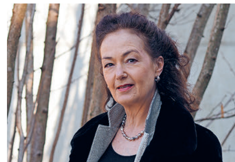
Die bekannte Schauspielerin Dorothee Reize spricht die erzählerischen Texte der Passion.