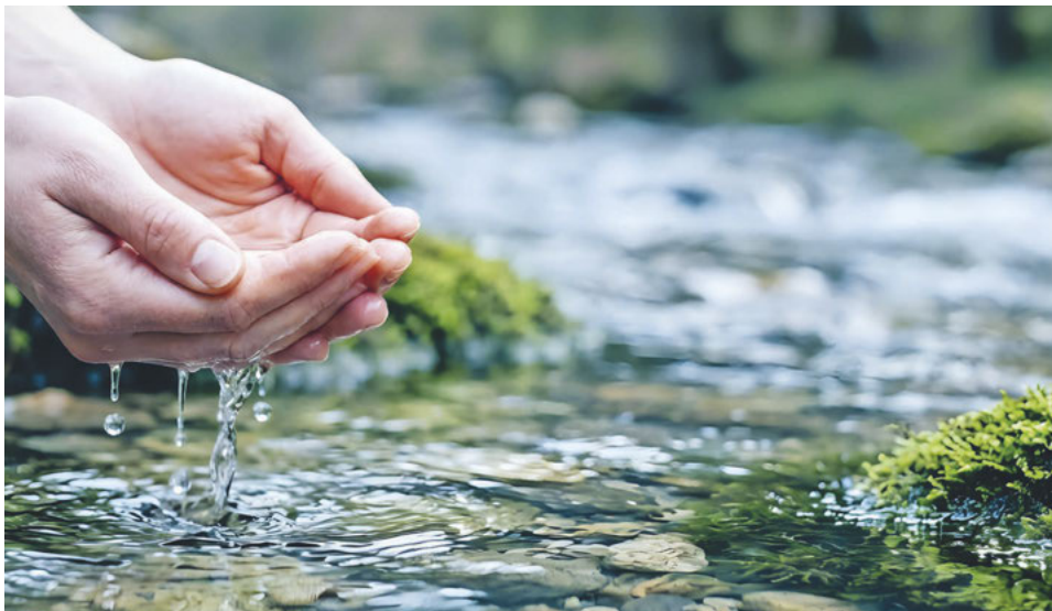
Im Alltag eine fixe Zeit für Stille und Gebet zu reservieren – für viele Teilnehmer*innen fühlt sich das an wie der Gang zu einer Quelle, um aufzutanken, um zu sich zu kommen.

Hier wird Gemeinschaft erlebt über den Austausch der eigenen Erfahrungen. Hier wird gesungen, getanzt, gebetet und Stille angeleitet. An vielen Orten wird den Teilnehmer*innen zusätzlich die geistliche Begleitung empfohlen, um einmal pro Monat im Vieraugespräch über Widerstände und auftretende Fragen sprechen zu können. Zugleich fördert das Projekt die Ökumene, da sich Katholikinnen, Reformierte und Freikirchliche gemeinsam auf diesen Weg begeben. Eine Teilnehmerin sagt: «Diese Grossen Exerzitien boomen – weil sie