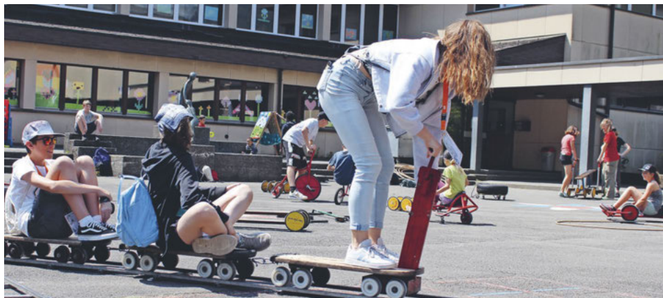
Spiel, Spass und das Erlebnis vom Gemeinschaft – darum geht es beim Urner Ministrantentreffen.

Das Ministranten-Treffen 2026 verspricht einen Tag voller Freude, neuer Begegnungen und wertvoller Erfahrungen – ein Anlass, der den Gemeinschaftssinn stärkt und lange in Erinnerung bleiben wird.