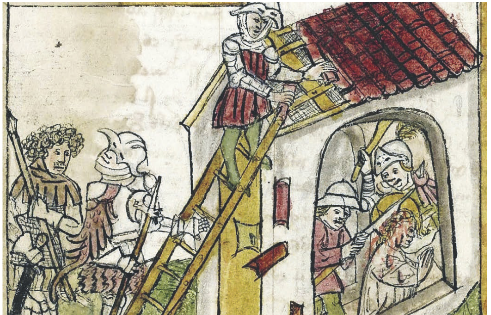
Über das Dach gelangten die Hunnen ins Innere der Kirche und erschlugen Wiborada.

Sie reiht sich ein in das Kapitel der unsichtbar gemachten Frauen, obwohl sie die erste in einem offiziell römischen Verfahren hei-