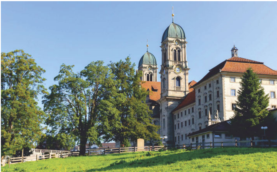
Das Dekanat Innerschwyz lädt im Mai zur gemeinsamen Wallfahrt ein.