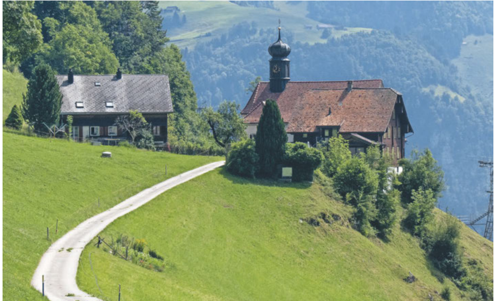
Idyllisch schmiegt sich die Holzwang-Kapelle an den Wiesenhang.

Bald kommt unser erstes Ziel in Sicht: Am Rand der Krete ragt aus dem Wald ein spitzer Kirchturm heraus. Von der Alp Ober Holzwang aus führt ein kleiner Weg direkt durch den Wald zur weissen Holzwang-Kapelle. Diese liegt auf 1443 m und wurde 1905 erbaut. Früher soll hier ein Marienbildstöckli gestanden haben.