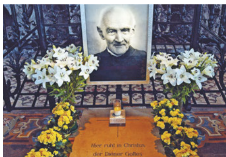
Auch die Gedenkstätte für Br. Meinrad hinten in der Klosterkirche wurde neu gestaltet.