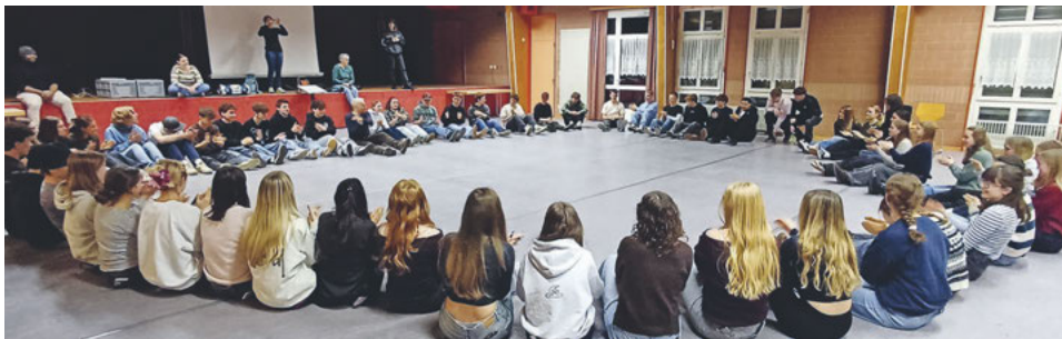
Das Erleben von Gemeinschaft, aber auch neue Perspektiven auf Glaubens- und Sinnfragen stehen im Mittelpunkt des neuen Unterrichtsmodells.