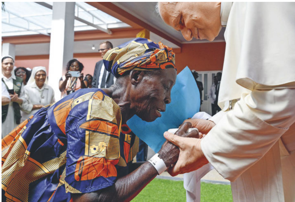
Nicht nur Politiker – Papst Leo ging es bei seinem Besuch auch um die Begegnung mit «gewöhnlichen» und oft vergessenen Menschen, hier bei einem Besuch im Seniorenheim in Saurimo in Angola.

Gott sei nicht mit den boshaften, ammassenden und hochmütigen Menschen. «Das Herz Gottes schlägt für die Kleinen und Demütigen und mit ihnen baut er Tag für Tag sein Reich der Liebe und des Friedens auf.», erinnerte der Papst die Gläubigen. Und er stellte in seinem nächsten Reiseland Kamerun klar: «Selig sind die Friedensstifter! Wehe jedoch denen, die die Religionen und selbst den Namen Gottes für ihre militärischen, wirtschaftlichen und politischen Zwecke verbiegen und damit das Heilige in